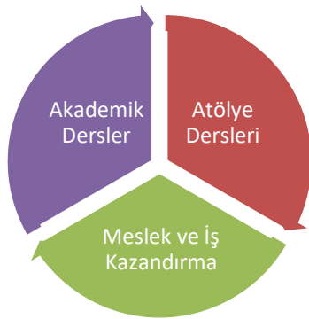
Şekil 1. Okulumuzun Eğitim Şeması

Okulumuz, hafif düzeyde zihinsel yetersizliği olan bireylere iş ve meslek kazandırmayı hedeflemektedir. Bu doğrultuda, akademik derslerin yanı sıra atölye çalışmaları da önemli bir yer tutmakta ve eğitim sürecinde ağırlıklı olarak yer almaktadır.